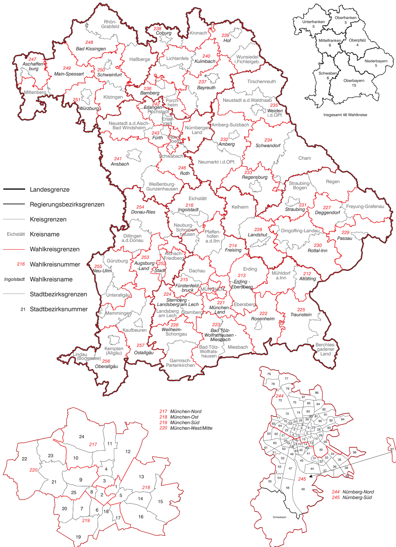
Abb. 1 Wahlkreis Bayern zur Bundestagswahl 2021